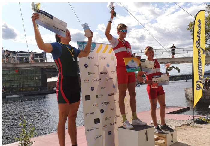
Premieutdeling 2022 Menn, Senior

De raskeste båtene i hver klasse kvalifiseres til sprintduellene.